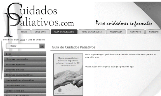
Ilustración 5. Guía de cuidados

-Guía de cuidados: Esta área contiene toda la información (síntomas objetivos y subjetivos, autocuidados del cuidador, contactos de interés y nota al autor) descrita en el manual. Los síntomas se han estructurado de igual forma que en el manual (Ilustración 5): ¿Qué es?, clasificación y tipos, valoración, ¿cómo actuar? y ¿qué hacer para retardar su