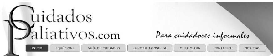
Ilustración 1. Menú principal

Este menú siempre mantiene la misma posición para que el usuario se encuentre localizado desde cualquier subnivel. Justamente debajo del menú principal el usuario podrá encontrar un componente muy típico de todos los sitios web llamado “migas de pan”, mediante las cuales el usuario sabrá el subnivel en el que está en cada momento. Ej: Usted está aquí: Inicio/ Guía de cuidados/ Dolor/ ¿Cómo actuar ante el dolor?