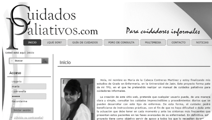
Ilustración 4. Sección de inicio

-¿Qué son?: En este apartado el usuario podrá encontrar una breve introducción sobre los cuidados paliativos, ¿qué pueden hacer ellos como cuidadores? y ¿cómo pueden manejar dicha guía?