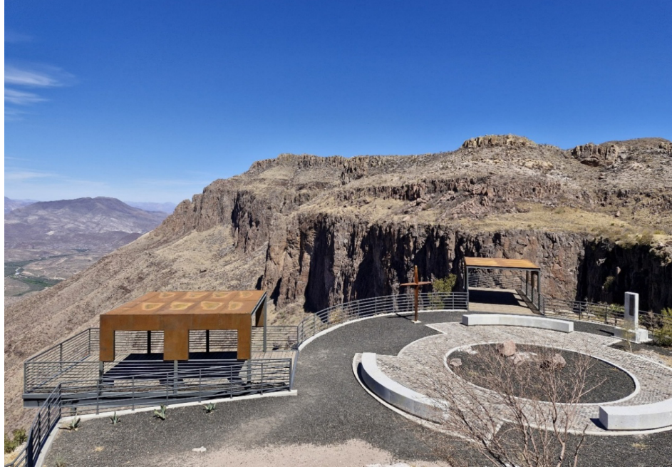
Imagen 2. Mirador La Cruz del Diablo, Huásabas, Sonora. México.