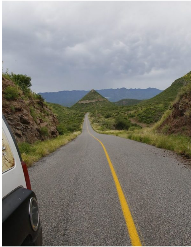
Imagen 3. Cerro La Pirinola, Bacadehuachi, Sonora. México.