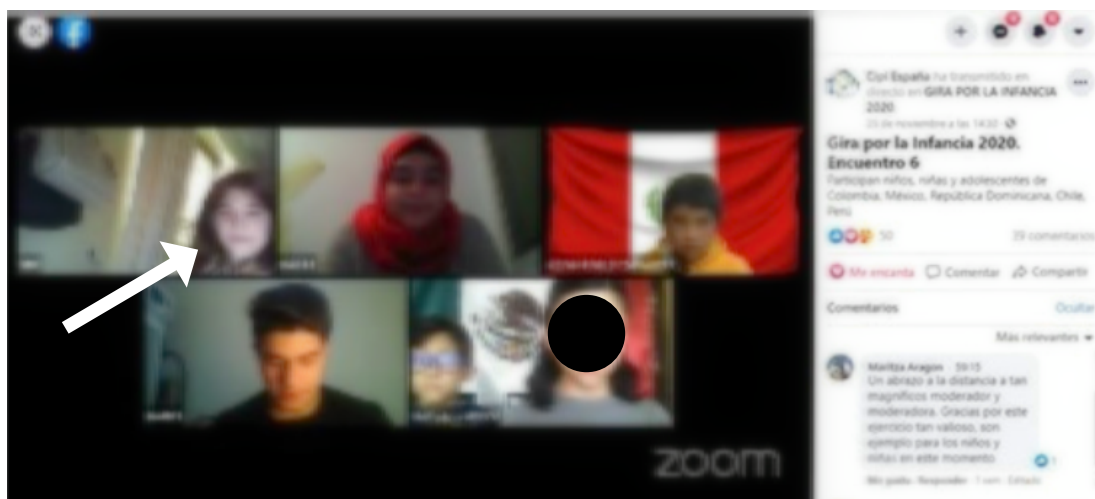
Figura N° 4: Transmisión online del Sexto Encuentro de la Gira Mundial por la Infancia 2020